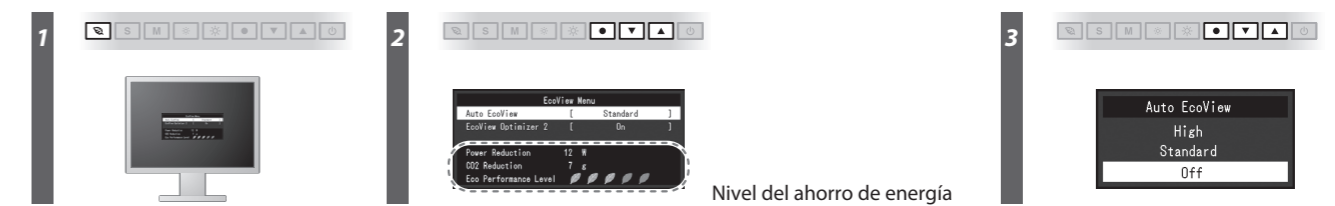
Nivel del ahorro de energía

O monitor ajusta automaticamente o brilho do ecrã de acordo com o nível de branco do sinal de entrada. Esta função pode reduzir o consumo de energia, mantendo o brilho especificado pelo sinal de entrada.